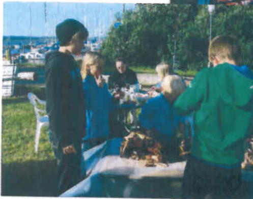
Ungerne var også tilfredse med menuen