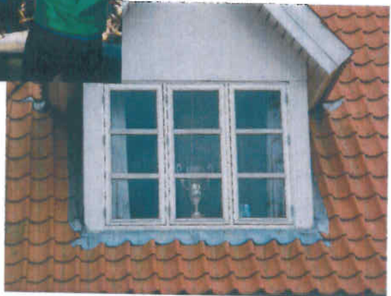
En sjælden værdig plads til pokalen